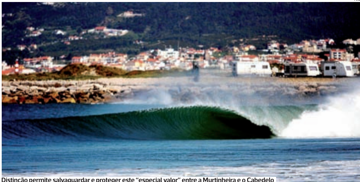
Distinção permite salvaguardar e proteger este “especial valor” entre a Murtinheira e o Cabedelo

●●● As ondas do Cabo Mondego, entre a Murtinheira e o Cabedelo, foram reconhecidas como ondas com especial valor para a prática dos desportos de deslize – Nível I, com a entrada em vigor do Programa da Orla Costeira (POC) Ovar – Marinha Grande, publicado na passada quinta-feira, dia 10