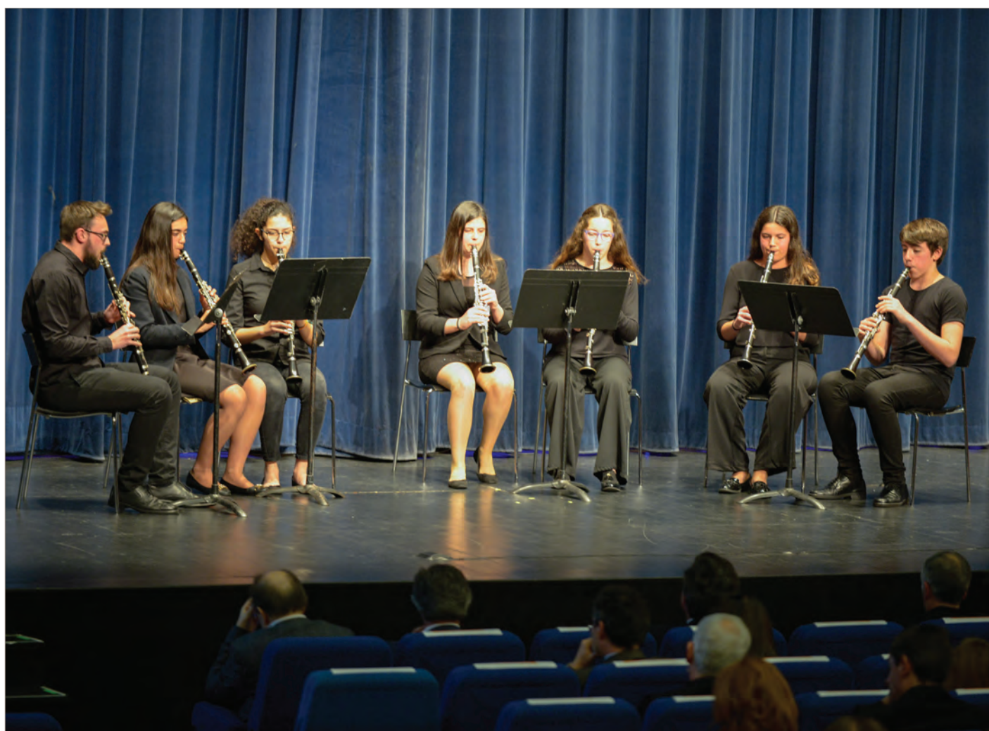
Conservatório de Música David de Sousa