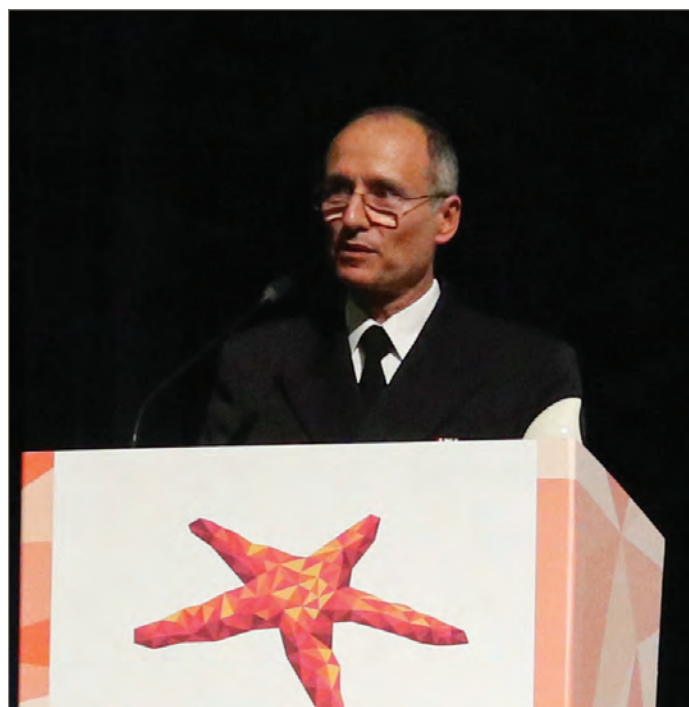
Senhor Contra-Almirante Coelho Cândido