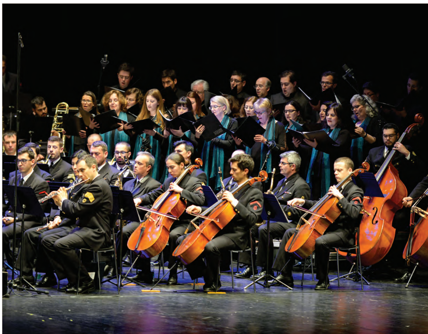
Coro Regina Coeli de Lisboa